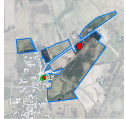
Figur 1 ny 'udflyttet' bolig på Trolleborgevej med jordtilliggender